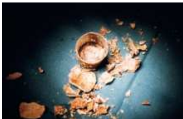
Fig 1. Caso 1. Fístula vesicovaginal. Capuchón de plástico totalmente calcificado.

En la actualidad es más frecuente hallar un cuerpo extraño en casos psiquiátricos, y como bultos colocados en la vagina para ocultar drogas de contrabando.