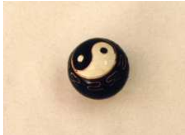
Fig. 3. Caso 3. Problema sexual. Bolas musicales chinas.

Mujer de 52 años, nuligesta, con antecedentes de histerectomía total más doble anexectomía por útero miomatoso. Seguía THS estrogénico de la menopausia. Consultó de urgencia porque durante el juego sexual con su pareja, le había introducido dos bolas chinas musicales (fig. 3), y no había podido extraer la segunda de ellas. Ésta se encontraba en el fondo de la vagina, perfectamente incrustada en la cúpula vaginal. Para extraerla introdujimos un dedo en la vagina