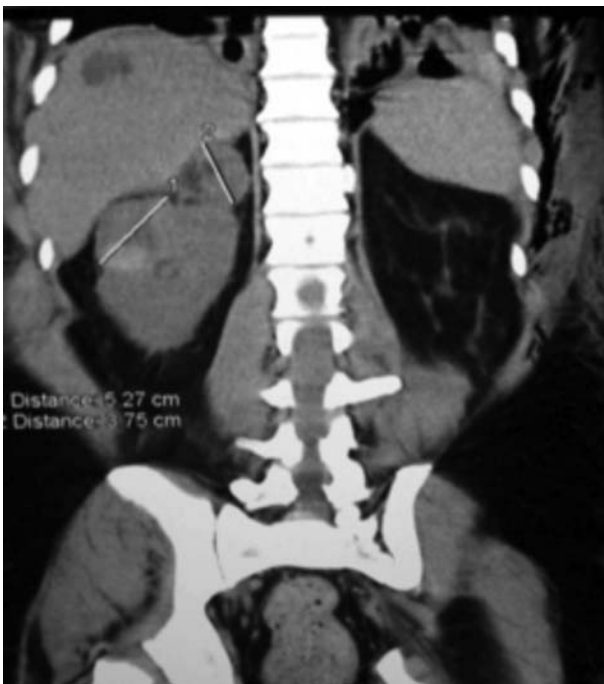
Imagen 1. TC de abdomen que muestra la lesión tumoral en el riñón derecho y suprarrenal del mismo lado.

Se realizó gammagrama renal con DTPA para conocer la función renal con tasa de filtración glomerular de FGRD de 28 ml/min, FGRI de 68 mL/min, gammagrama óseo y telerradiografía de tórax negativos a metástasis. Se decidió programar de manera electiva para nefrectomía radical derecha por técnica laparoscópica, la cual se realizó con complicación para el control vascular del hilio renal, por lo que requirió de conversión a técnica mano asistida, para lograr control del mismo; con una duración aproximada de 160 minutos; cursando con adecuada evolución posoperatoria, siendo egresado al tercer día del evento quirúrgico. El resultado histopatológico fue de carcinoma de células renales con diferenciación sarcomatoide de 3 cm por 4 cm, confinado a la cápsula renal con márgenes quirúrgicos negativos y carcinoma de corteza suprarrenal de 4 cm por 3 cm con invasión capsular y vascular ( Imagen 2 ).