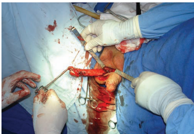
Foto 2. Fotografía durante el transquirúrgico al momento de realizar la falectomía del pene superior.