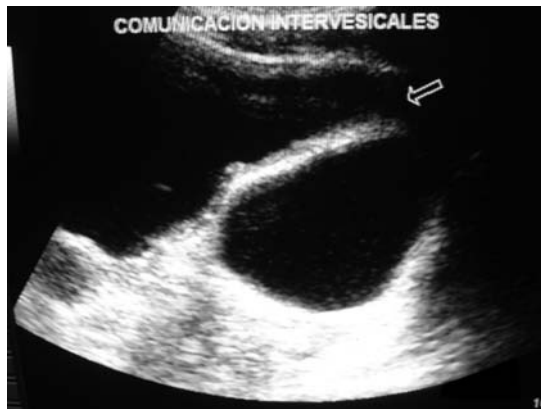
Imagen 2. Se aprecia el tabique intervesical que separa ambas vejigas y en la parte superior la comunicación que existe entre ellas, así como la presencia de sedimento urinario.