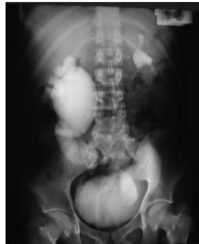
Imagen 3. Urografía excretora se aprecia dilatación ureteropielocaliceal severa a la hora de administrado el contraste del riñón de lado derecho, el riñón izquierdo concentrando y eliminando adecuadamente el material de contraste.