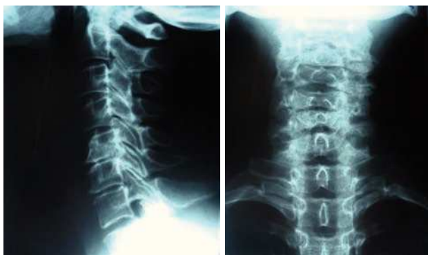
Fig. 1: Espondiloartrosis cervical C5-C6 (severa) y C6-C7 con rectificación de la lordosis cervical.

Como base del tratamiento de electroacupuntura pueden usarse los siguientes puntos, muy útiles en la gran mayoría de cervicalgias: