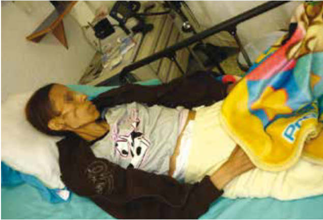
Figura 3 Manejo en hospital de día. En el Servicios de Cuidados Paliativos el personal tiene la capacitación para proporcionar un ambiente confortable a los pacientes que se encuentran en agonía; sin embargo, se prefiere proporcionar la información necesaria para evitar traslados al hospital al final de la vida.

tolerancia a la movilización, la monitorización al inicio de la sedación Ramsey III de signos vitales fueron: TA 80/40 mmHg, FC 120x', FR 22x', T: 35.8°C, Saturación O 2 70%. La paciente fallece 48 horas después, sin datos de sufrimiento rodeada de su familia. Enfermería permite se despidan y toma la tira de electrocardiograma (ECG), preparan el cuerpo y lo traslada a la morgue del hospital.