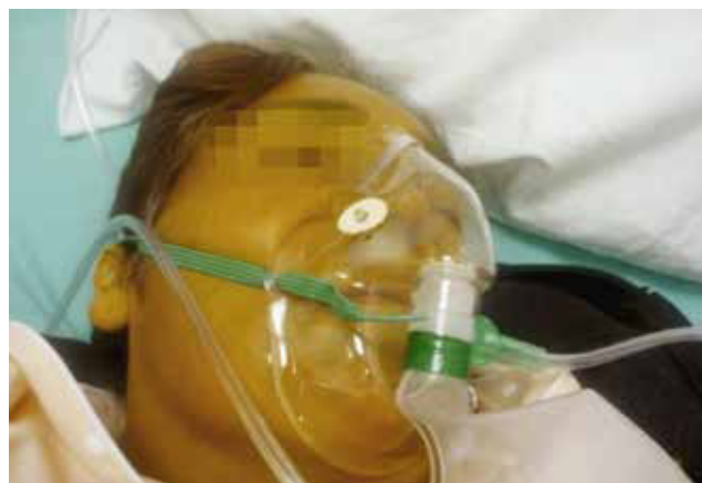
Figura 1 Paciente en agonía, refieren familiares 24 horas de evolución con trastornos del estado de conciencia, intolerancia a la vía oral, cambios de coloración de la piel e incontinencia de esfínteres.

Por esto es necesario contar con un plan de atención y revisarse con frecuencia, para identificar cuál es el estado del enfermo y la capacidad de la familia para enfrentar las