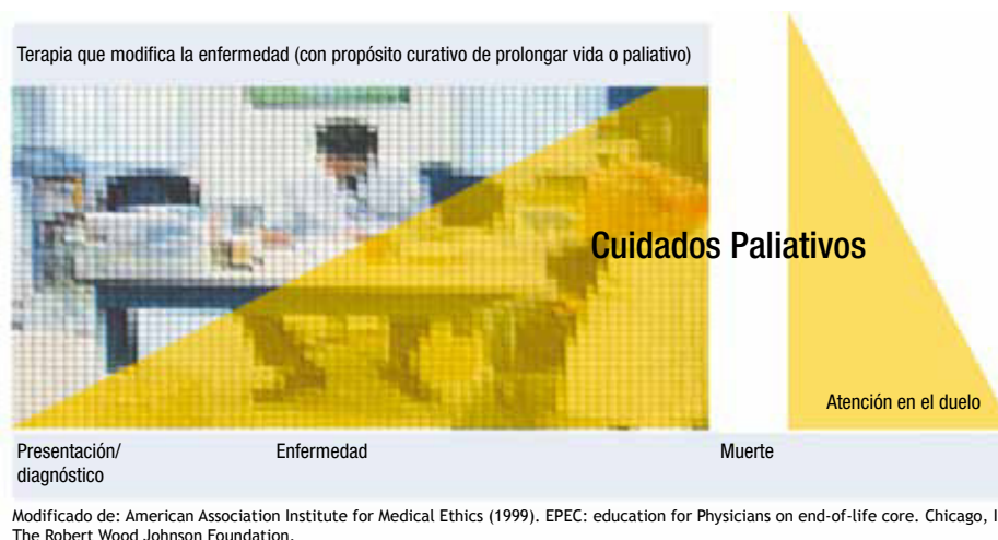
Figura 1 En las enfermedades crónicas e incurables, en la actualidad se refieren pacientes a cuidados paliativos en la etapa terminal. De acuerdo a la recomendación de la American Medical Association , la atención paliativa es progresiva, debe iniciarse con el diagnóstico, continuarse durante el tratamiento y extenderse a la atención de los familiares en el periodo del duelo.

77.7 miles de mexicanos de ambos sexos murieron por cáncer 10 .