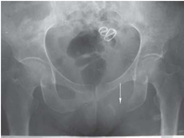
Figura 2. Osteolisis del isquion izquierdo.