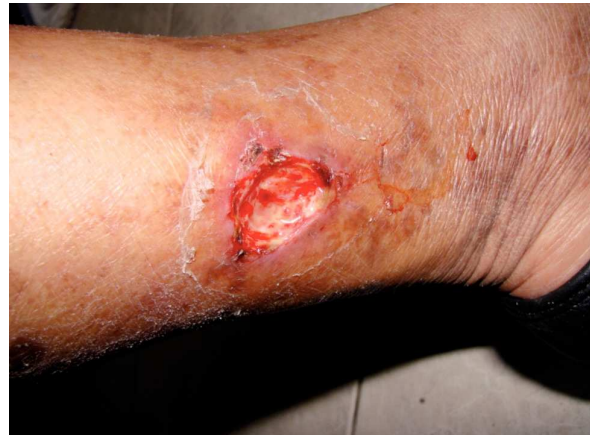
Figura 1. Úlcera de Martorell en cara medial de la pierna izquierda.

manera ambulatoria con desbridación mecánica, sesiones de carboxiterapia, crema con una mezcla de óxido de zinc, cumarina y difenilhidantoina y parches de hidrocoloide con alginato de calcio. Debido a los datos clínicos, y apoyado por los estudios bacteriológicos de la herida sin evidencia de infección, no hubo necesidad de administrar antibióticos. La hipertensión se trató con hidroclorotiazida y losartán, el manejo del dolor con paracetamol y tramadol con horario, junto con buprenorfina por razón necesaria. La úlcera evolucionó satisfactoriamente sin presentar complicaciones y cicatrizó en un periodo de seis semanas.