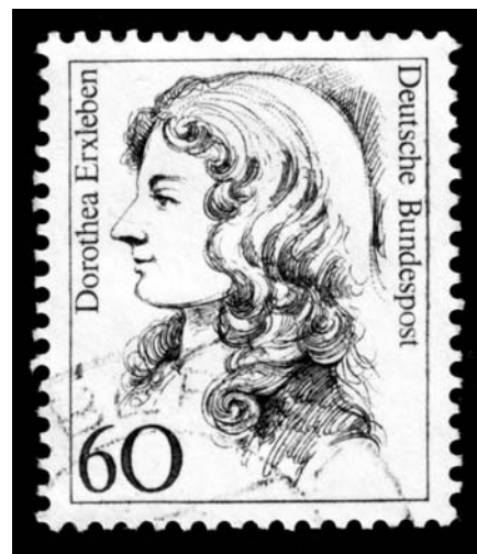
Figura 1. Dorothea Christiane Erxleben. Sello germano de 1987, “Serie de Mujeres en la historia alemana”.

sometida por tener expectativas diferentes. Con inapreciable léxico, arguye la habilidad filosófica y científica; señala que el conocimiento está distribuido equitativamente entre géneros, pero que la mitad de la humanidad no tiene acceso a la buena educación para desarrollarse.* Usa su conocimiento filosófico, teológico y científico para describir dos milenios de misoginia de los líderes de la Iglesia, filósofos y hombres de ley.