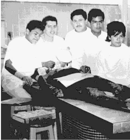
Figura 3. Matilde Montoya acompañada por sus compañeros apodados Los Montoyos.

la primera mexicana graduada de la Escuela de Medicina de México.