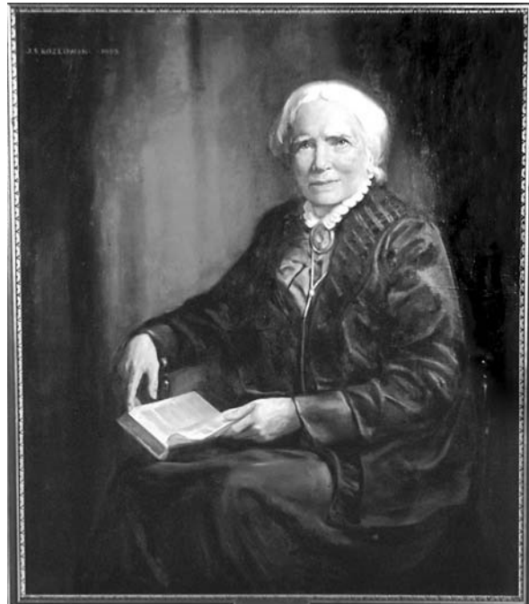
Figura 2. Elizabeth Blackwell, 1963, retrato de Joseph Stanley Kozlowski.

Nombró a la doctora Rachel Cole, primera mujer afro-americana que se graduó de medicina en Estados Unidos, como su compañera en la dirección del establecimiento. 3