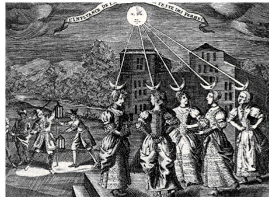
Figura 3. En el Siglo XVII se colocaba al género femenino bajo la influencia de la Luna, que gobernaba las aguas, incluso el flujo mensual de las mujeres. Gustav Reynier, 1685.

de estatuas posteriores donde aparece como una mujer triple. Así es que el Sol representa al hombre, ya que es una constante fuente de luz, mientras que la Luna, por ser cambiante y seguir un orden diferente es la imagen característica de la mujer. Los cambios que se aprecian durante el ciclo lunar reflejaban el mundo físico y psíquico de la mujer, como un signo de inconstancia y variabilidad tanto física como espiritual ( Figura 2 ).