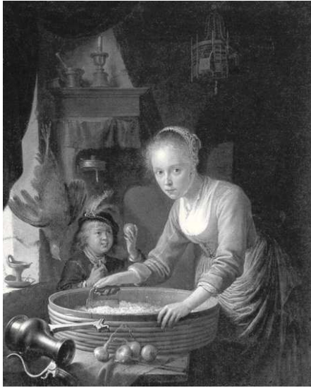
Figura 4. La descripción de la belleza femenina en el Siglo XVII era la de la típica fisonomía lunar —una cara redonda y ojos justos... y un cuerpo suave. Joven cortando cebollas. Gerrit Dou, 1646.