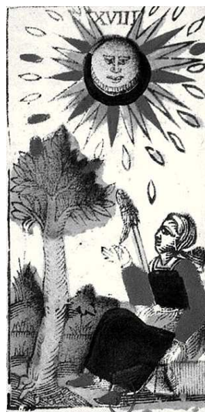
Figura 1. En el tarot Vieville (Siglo XVII) la carta XVIII de la Luna muestra una mujer hilando bajo la influencia de ese astro, pero con una clara presencia del sol.

estaciones mediante múltiplos de los ciclos lunares, descubrieron el ciclo metónico, que consta de diecinueve años y recibe este nombre por el astrónomo Metón. 4