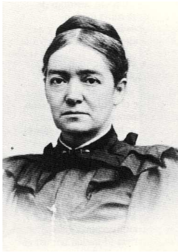
Figura 6. Dra. Mary Putnam Jacobi (1842-1906).