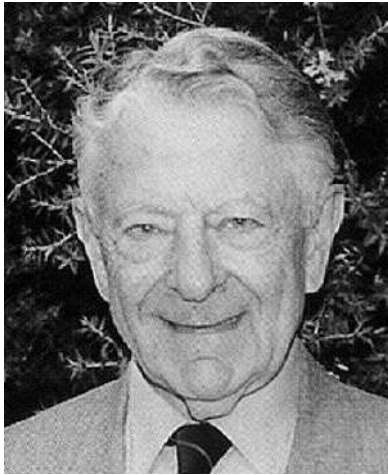
Figura 9. John Billings (1918-2007).