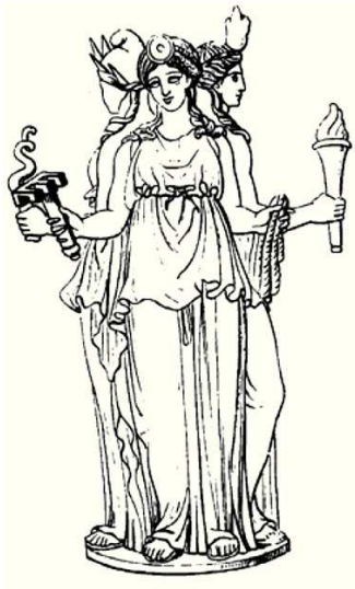
Figura 2. La Luna en Grecia se veía como una diosa triforme: la diosa Hécate representaba a la Luna oscura; Selene en el cielo a la Luna creciente, y Artemisa a la Luna llena.

luz. El nombre griego de la Luna, Selene, deriva de selēnon , pequeña Luna; diminutivo de Selene-es , Luna llena, blanca, clara; que viene de selas, selaos , claridad, fuego, luz brillante, éste de ele o eile-es , calor del Sol, rayos del Sol; porque lo refleja la Luna llena. 5