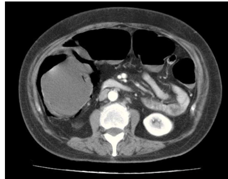
Figura 4 Neumatosis intestinal en TAC de abdomen.