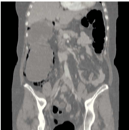
Figura 3 TAC de abdomen con distensión cecal.