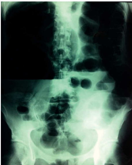
Figura 1 Placa simple de abdomen con dilatación en ciego y nivel hidroaéreo.

Se decide su ingreso hospitalario a cargo del departamento de Cirugía General para manejo protocolizado. Durante su estancia hospitalaria, persiste con dolor abdominal generalizado, tipo cólico, de intensidad moderada, constante, sin irradiaciones ni exacerbaciones, náusea ocasional, sin vómito; refiere distensión abdominal importante e incapacidad para canalizar gases de manera progresiva. Se solicita tomografía computarizada, la cual muestra distensión de