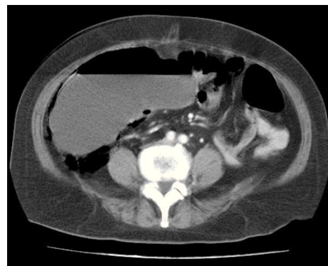
Figura 5 TAC de abdomen con dilatación cecal y neumatosis intestinal.