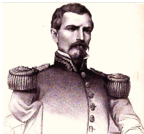
Figura 1 Imagen del General Luis G. Osollo

Del grupo de Generales jóvenes forjados a mediados del siglo XIX, se desempeñó como uno de los más brillantes colaboradores del régimen conservador 15 , destacándose en la Batalla de Ocotlán, como un prometedor estratega 16 . Durante la Batalla de los Cerros de Magdalena en la Sierra Gorda