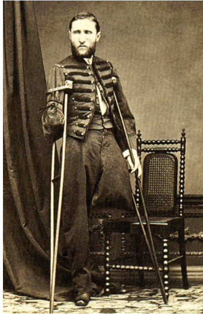
Figura 3 Imagen del General Carlos Pacheco.