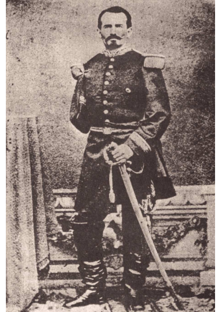
Figura 4 Imagen del General Manuel del Refugio González.

brazo del antebrazo, se trasladó de inmediato a un quirófano 28 y fue intervenido por los médicos cirujanos Senorio Cendejas, Enrique C. Osorno y Heberto Alcázar 29,30 , quien realizó una amputación por arriba del codo en dos etapas, ya que el general Obregón conservó el tercio medio y proximal (fig. 5), sin ya realizarse la amputación clásica ni de Larrey ni la de Montes de Oca, sino un procedimiento más conservador, preservando un muñón envuelto por un colgajo de piel.