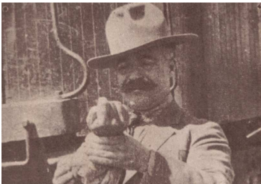
Figura 5 Imagen del antebrazo del General Álvaro Obregón cargado por el General Médico Cirujano Enrique C. Osorno

Representante de la nueva escuela paisajista mexicana que retrató los volcanes a inicios del siglo xx; sufrió un cuadro de insuficiencia vascular en 1949, por lo cual tuvo que ser amputado de su pierna, con un procedimiento supracondileo 31 , continuó pintando hasta los 85 años 32 .