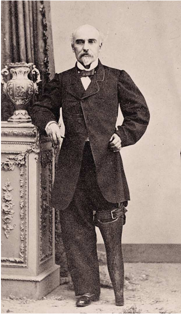
Figura 2 Imagen del General José López Uruga.