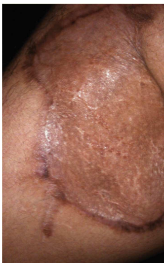
Figura 4 Mismo paciente a los 2 meses del tratamiento.