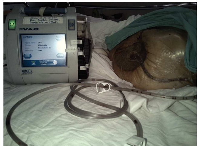
Figura 1 Terapia de presión negativa con sistema V.A.C. (Vacuum Assisted Closure) (KCI Co. U.S.A.)

La terapia de presión negativa se puede aplicar en cualquier tejido siempre y cuando esté bien vascularizado (ya que la necrosis puede ocurrir cuando se aplica en heridas isquémicas 14 ) y que la herida este libre de tejido necrótico. Las contraindicaciones son pocas pero se deben tomar en cuenta, destacan las siguientes: heridas con tejido necrótico, osteomielitis no tratada, fístulas, malignidad, aplicar directamente la esponja sobre arterias y venas expuestas. 7,15