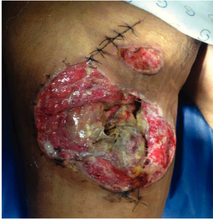
Figura 2 Paciente masculino de 23 años de edad con herida por arma de fuego en miembro pélvico derecho