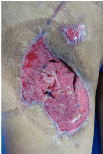
Figura 3 Mismo paciente manejado con desbridamiento quirúrgico, terapia V.A.C.® durante 2 semanas y posteriormente aplicación de Alloderm®