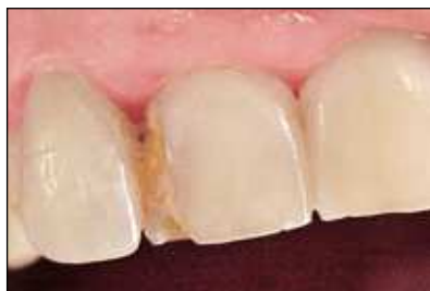
Figura 8 Caries Clase IV.