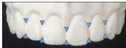
Figura 5 Las troneras cervicales deben estar ocupadas por encía y los ángulos incisales abiertos.