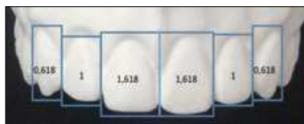
Figura 6 Los dientes deben guardar una proporción áurea.

más corta, adquiriendo un aspecto más azulado. La zona de unión entre el esmalte y la dentina crea lo que se denomina «halo incisal» que toma apariencias distintas. Se puede observar en forma de borde continuo, de forma trilobulada, trilobulado con el central bífido o con una disposición en penachos.