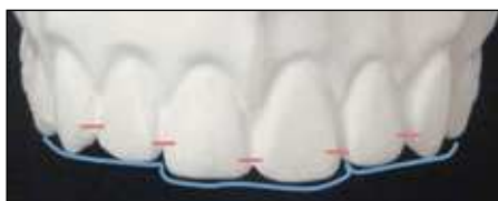
Figura 3 El contacto interdentual tiene su punto más bajo entre los incisivos centrales y aumenta de forma ascendente hacia distal. El contorno de los bordes incisales tiene aspecto de «plato hondo».

(emisión de luz visible de un cuerpo, cuando este se expone a la luz ultravioleta 25 .