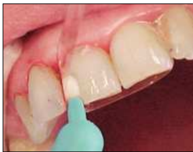
Figura 9 Colocación del composite con una matriz de acetato.