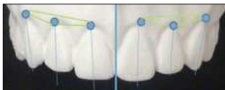
Figura 2 Los ejes mayores de los dientes en general tienen una inclinación a mesial en sentido coronal. Son coincidentes con la línea media y no paralelos. El zenit gingival está distalizado.