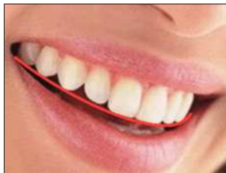
Figura 4 El labio inferior sigue el contorno de los dientes superiores.

En el tercio incisal, la zona adamantina más translúcida produce la difusión de los rayos a una longitud de onda