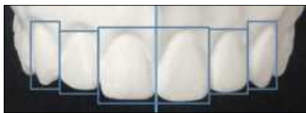
Figura 1 Línea media centrada. Simetría en el tamaño dentario.