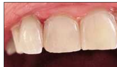
Figura 10 Caso terminado.

dos más precisos y de mayor y mejor calidad 31 (figuras 8, 9 y 10).