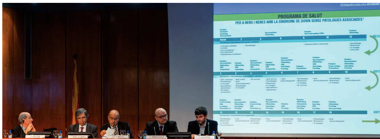
Presentación de la Unidad de Síndrome de Down y Alzheimer.