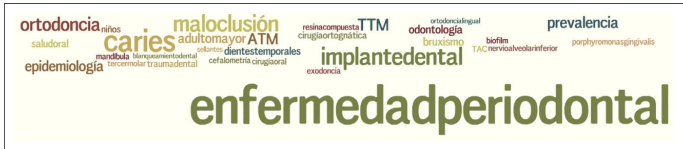
Figura 1. Nube de las 30 palabras clave más utilizadas por publicaciones en revistas dentales científicas chilenas en el período 2002-2012.

nera significativa, pues representan menos del 1% de las publicaciones del período. No hay estudios previos con los que se puedan comparar estos resultados, y los que hay en Chile se refieren a la autoría en una revista médica 12 , y en el ámbito internacional, acerca de revistas dentales específicas 13-15 , sobre temas concretos como ortodoncia 16 o de escuelas dentales de un país, como Sudáfrica 9 . Este incremento de publicaciones en revistas dentales científicas de Chile podría explicarse, por una lado, debido al aumento de instituciones en Chile que dictan la carrera de Odontología, que pasó de 6 a 20 en el período en estudio 3 . Los datos muestran, además, que 2 instituciones, la Universidad de Chile y la Universidad de La Frontera, son las que más han aumentado su autoría en publicaciones científicas en revistas odontológicas chilenas. Por otra parte, este aumento se explicaría porque cada vez más autores extranjeros están publicando en revistas dentales chilenas. Es así como las publicaciones de autores de otros países aumentan de 7 en 2002 hasta 143 en 2012.