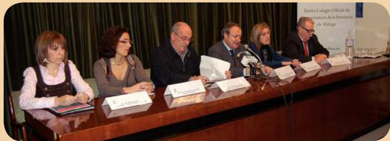
La campaña ha sido promovida por el Consejo General de COF andaluz.