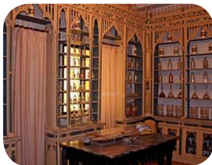
Una imagen del renovado museo.