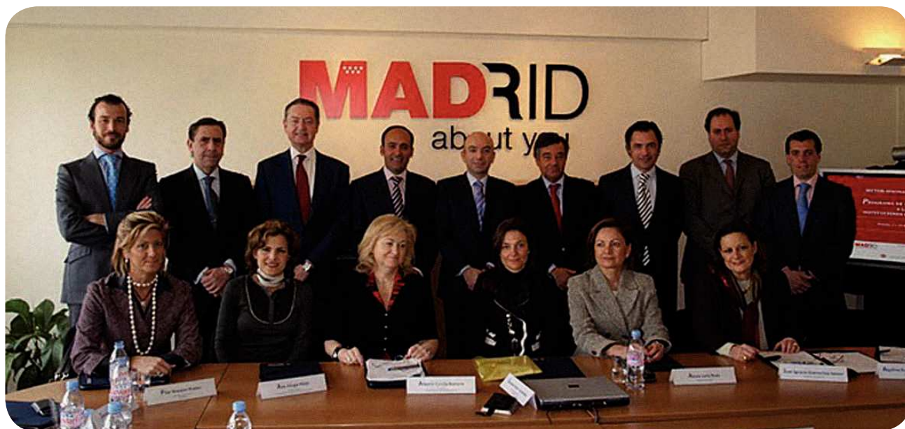
La delegación al completo.