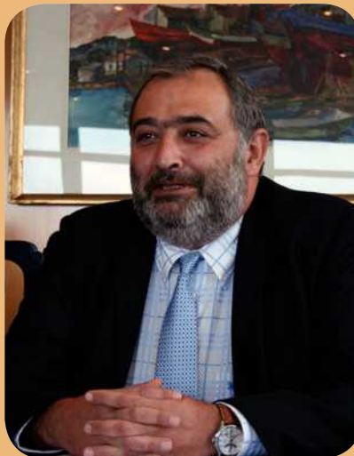
Fernando Redondo, presidente de FEFE.

El pasado 13 de abril, justo un día antes de que el Parlamento convalidara el Real Decreto-Ley 4/2010, el presidente de la Federación Empresarial de Farmacéuticos Españoles, Fernando Redondo, compareció en la Subcomisión del Pacto de Estado por la Sanidad del Congreso de los Diputados para hacer un análisis de la sostenibilidad del actual SNS, ofreciendo datos sobre el sector de oficinas de farmacia, comentando el impacto que sobre él tendría el nuevo decreto y proponiendo medidas alternativas. El nuevo texto legal fue, pese al notable esfuerzo de la patronal, finalmente aprobado, pero sus propuestas quedan sobre el tapete. En su comparecencia Redondo abogó, en síntesis, por: