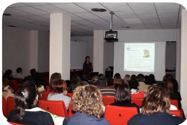
Los boticarios toledanos se implicaron notablemente en la formación.

Esta experta centró su intervención en la importancia de seguir una dieta variada, suficiente y equilibrada. «Una dieta equilibrada debe contener hidratos de carbono de manera principal, ya que son los nutrientes que nos aportan la energía que necesitamos. Cuando se empieza una dieta se tiende a eliminar el pan y las legumbres por su contenido energético, sin embargo los hidratos de carbono son los macronutrientes bá-