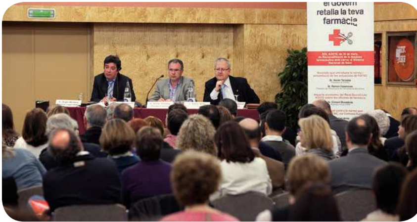
FEFAC organizó una conferencia para analizar posibles acciones contra el real decreto.