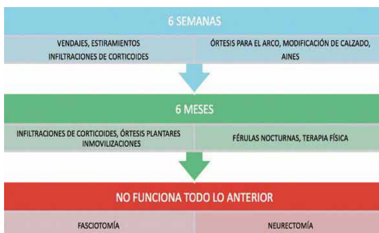
Imagen 6. Tratamiento del dolor plantar 30 .

El tratamiento debe abordarse desde un punto de vista conservador y si fracasa realizar un abordaje quirúrgico. Como tratamiento conservador está el farmacológico y el ortopodológico, fundamental, con órtesis plantares que controlen la pronación excesiva de retropie, con un soporte del ALI, además se puede realizar una modificación de la horma del zapato o utilización de taloneras. La utilización de prótesis nocturnas también presenta un buen resultado. También se pueden indicar las infiltraciones de corticoides, fisioterapia, y tratamiento osteopático. Los pacientes que presenten un cuadro combinado con fascitis responden mejor a este tratamiento conservador, en caso de pasar unos 6-12 meses y no responder, se procede a una infiltración de corticoides y anestésico con una doble función terapéutica y diagnóstica. Al tratarse de una patología que cursa con dolor de talón, se ha descrito un algoritmo terapéutico para el tratamiento 4, 5, 13, 22, 24, 25, 27-30 del mismo y que debemos de tener en cuenta y seguirlo (imagen 6).