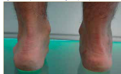
Figura 9: Valoración de la posición de los retropiés.

En dinámica se mantiene la actitud pronatoria observada en bipedestación, al apreciar una pronación muy marcada y mantenida en toda la fase del paso del