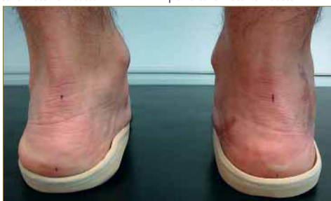
Figura 21: Prueba del tratamiento ortopodológico.

Se realizaron soportes termoconformados, siendo los materiales empleados en su confección: resina termomoldeable 2,36 de 1,8 mm, cubierta de EVA de 4 mm de 40 Shore A, taloneras integradas de porón 37 (Guillén) de 3mm y relleno de EVA de 5 mm de 40 Shore A 38 (Podociencia) (Fig. 19 - 21).