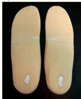
Figura 20: Visión posterior de los soportes plantares termoconformados.