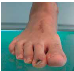
Figura 3: Cicatriz en zona dorsal del antepié.

Una vez mejoradas las condiciones locales tras dicho procedimiento quirúrgico, fue intervenido de la fractura de calcáneo, mediante fijación con osteosíntesis, tal y como se aprecian en las imágenes de las diferentes proyecciones radiológicas 16 (Fig. 4 y 5). Durante el tratamiento rehabilitador mediante fisioterapia, fue diagnosticado de Síndrome de Sudeck (distrofia simpático refleja), la cual le ha ocasionado, entre otros síntomas, la parestesia referida a nivel del primer dedo derecho.