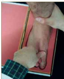
Figura 17: Toma de moldes en espuma fenólica. Carga relajada y descenso del primer metatarsiano pie derecho.

Para ello realizamos la toma de moldes en espuma fenólica 35 , realizando una carga relajada con maniobra de descenso del 1º metatarsiano en el pie derecho (Fig. 17). En el pie izquierdo optamos por las maniobras combinadas de contención de la pronación y extensión de la 1ª articulación metatarsofalángica (Fig. 18).