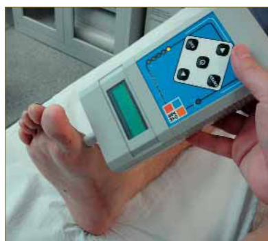
Figura 15: Aplicación del neurotensiómetro para valorar la sensibilidad vibratoria.