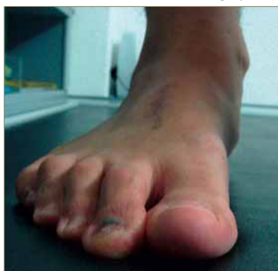
Figura 10: Comportamiento digital durante la estabilización flexora .

pie izquierdo. Sin embargo, el pie derecho presenta un mayor comportamiento en varo, con un choque de talón bastante intenso en varo 21 , escasa pronación durante todo el ciclo de la marcha y una evidente estabilización flexora 15 en la fase de medio apoyo 22 (Fig. 10).