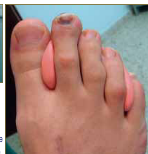
Figura 23: Visión dorsal de la ortesis de silicona adaptada al pie.