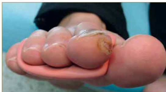
Figura 16: Visión anterior de la artesis de silicona. Ampolla en pulpejo 2º dedo derecho.

El dolor referido a nivel de tobillo derecho se localiza a nivel supramaleolar externo y provoca incluso cojera de forma puntual. Dicho síntoma se achaca, junto con el dolor subtalar 31, 32 (bursitis subcalcánea), al comportamiento en varo del retropié 21 , limitado en movimiento tanto en la articulación tibioperoneoas-tragalina como en la ASA, secundario a las fracturas, además de por la propia afectación ósea como consecuencia de la fractura de calcáneo.