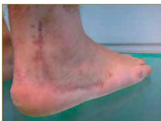
Figura 4: Cicatriz en zona retromaleolar externa y lateral del pie.

Una vez mejoradas las condiciones locales tras dicho procedimiento quirúrgico, fue intervenido de la fractura de calcáneo, mediante fijación con osteosíntesis, tal y como se aprecian en las imágenes de las diferentes proyecciones radiológicas 16 (Fig. 4 y 5). Durante el tratamiento rehabilitador mediante fisioterapia, fue diagnosticado de Síndrome de Sudeck (distrofia simpático refleja), la cual le ha ocasionado, entre otros síntomas, la parestesia referida a nivel del primer dedo derecho.