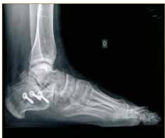
Figura 1: Proyección radiológica lateral. Fijación ósea en fractura de calcáneo.

Transcurridos 4 días desde la caída, se produjo un cuadro de síndrome compartimental en el pie afecto. Se procedió a la descompresión quirúrgica mediante la realización de fasciotomías (Fig. 1 - 3).