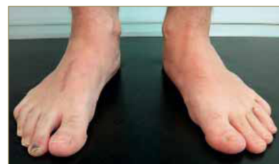
Figura 8: Comportamiento en valgo del pie izquierdo.

En bipedestación podemos apreciar tibias varas 20 asociadas a retropié valgus, comportamiento pronatorio más acusado en el pie izquierdo (PRCA 2° valgo derecho / PRCA 9° valgo izquierdo) (Fig. 8 y 9).