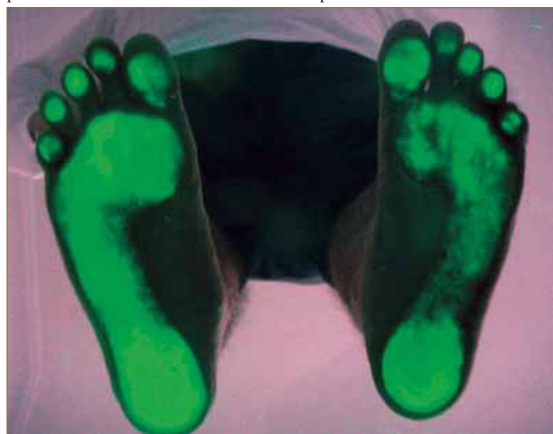
Figura 11: Huellas plantares. Insuficiencia del primer radio derecho con mayor área de apoyo en pulpejo del 1º dedo derecho por hallux limitus.

La valoración de la huella en el banco de marcha (Fig. 11) y el estudio computerizado de las presiones plantares (Fig. 12), tanto en estática como en dinámica, ponen de manifiesto la insuficiencia del primer metatarsiano 23 del pie derecho, factor etiológico principal apreciado del hallux limitus 24 , asociado al comportamiento derivado del antepié varo.