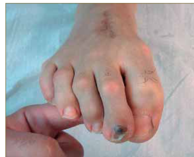
Figura 7: Insuficiencia del músculo cuadrado de Silvio.

El resultado de la valoración muscular es normal, a excepción del músculo cuadrado de Silvio 18, 19 , el cual es insuficiente en el pie derecho (Fig. 7).