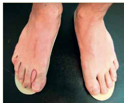
Figura 26: Aplicación de los soportes plantares y de la ortesis de silicona.