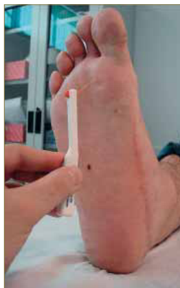
Figura 13: Valoración de la sensibilidad táctil con monofilamento de Semmes Weinstein 5.07.

Al referir parestesia, decidimos aplicar al paciente el test de valoración sensitiva mediante el monofilamento de Semmes - Weinstein 5.07 25, 26 (Fig. 13), el diapasón de Rydel Seiffer 27, 28 (Fig. 14) así como con el neurotensiómetro 29, 30 (Fig. 15), evidenciando los resultados de dichas pruebas clínicas la presencia de falta de sensibilidad táctil a nivel del primer radio.