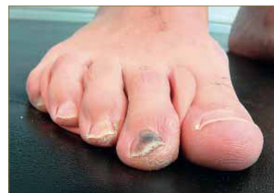
Figura 25: Comportamiento digital en carga con la ortesis de silicona aplicada.