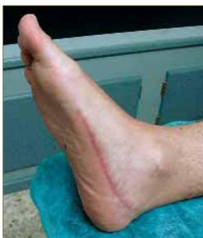
Figura 5: Cicatriz en zona medial del pie.