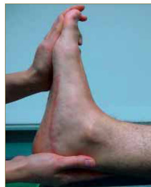
Figura 6: Valoración del rango de flexión dorsal del tobillo derecho.