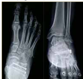
Figura 2: Proyección radiológica dorsoplantar y de Walter Müller.