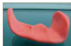
Figura 22: Ortesis de silicona con buen relleno de la zona subdigital.

Para ello optamos por la silicona tipo masilla 41 , ya que necesitamos volumen para llevar a cabo los objetivos planteados. Seleccionamos una dureza de 30 Shore A 38 y confeccionamos una ortesis compuesta por una barra subdigital y anclajes a nivel del 1º y 4º espacio interdigital 42 (Fig. 16 y 22 - 26).