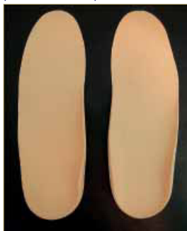
Figura 19: Visión anterior de los soportes plantares termoconformados.