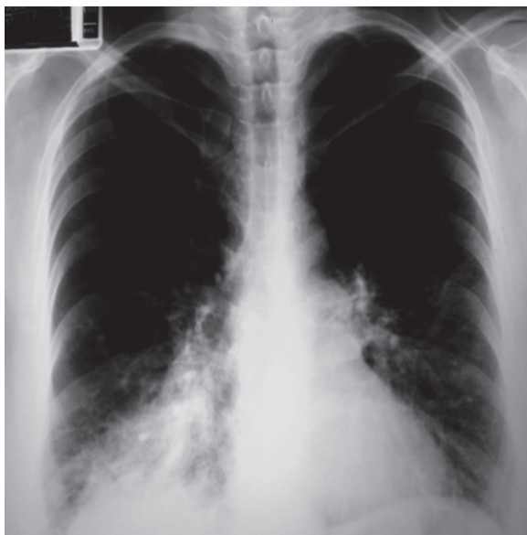
» Figura 1. Tele-radiografía de tórax PA con opacidad heterogénea en región basal interna derecha. Signo de la silueta.

Los síntomas suelen ser inespecíficos, lo que retrasa el diagnóstico, incluso puede ser asintomático en 25% de los casos. La presentación clínica más frecuente es tos crónica y producción de esputo mucopurulento o hemoptoico que están en relación con el grado de inflamación y/o infección, otros síntomas son fiebre, anorexia y puede presentarse hemoptisis. Los signos y síntomas dependen de la rapidez del cierre bronquial, del porcentaje de pulmón afectado y de si existe una infección asociada, en la auscultación pueden encontrarse sibilancias unilaterales. La presencia de bronquiectasias favorece el sangrado, la evolución crónica y el mal pronóstico. Parte del diagnóstico se basa en los hallazgos de la radiografía de tórax, donde se observa signo de la silueta, la radiografía lateral muestra una opacidad con tendencia mayor o menor a ser homogénea si predomina ya sea la atelectasia o neumonitis y heterogénea si predominan las bronquiectasias, es generalmente triangular, que va del margen cardiaco posterior a la pared torácica anterior. Se recomienda realizar una tomografía de alta resolución de tórax para el diagnóstico de bronquiectasias, este estudio tiene 25% de falsos negativos y 1% de falsos positivos. 7