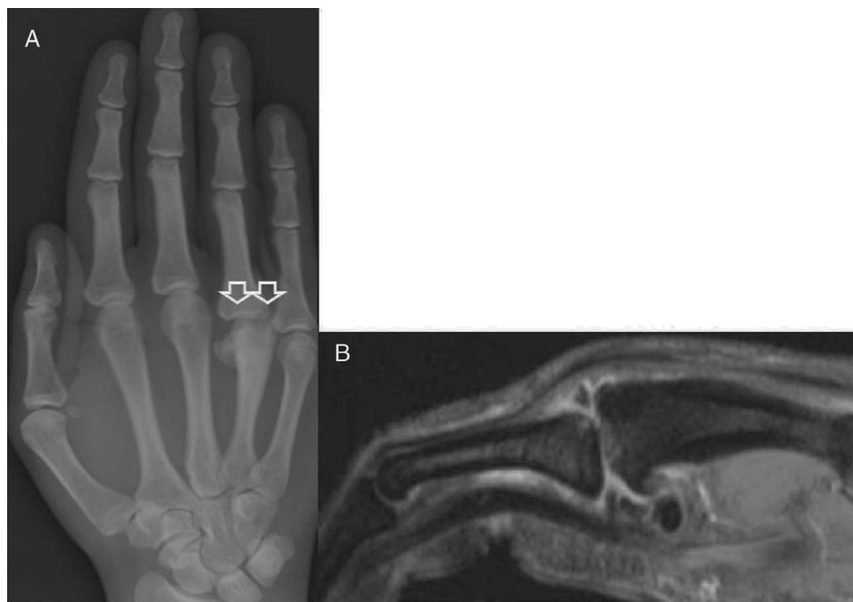
Figura 1 – A) Radiografía dorso-palmar de la mano derecha mostrando colapso subcondral de la cabeza del metacarpiano y subluxación de la articulación MTCF. B) Resonancia magnética con área de osteonecrosis en la cabeza del cuarto metacarpiano.

Durante el control clínico realizado a los 8 años del comienzo de los síntomas, el paciente presentaba una puntuación de 10 en el cuestionario Disabilities of the Arm, Shoulder and Hand (DASH). La radiografía simple reveló una remodelación de la articulación MTC y signos de consolidación ósea de la fractura metacarpiana presentando una movilidad activa completa y no dolorosa de los dedos (fig. 2).