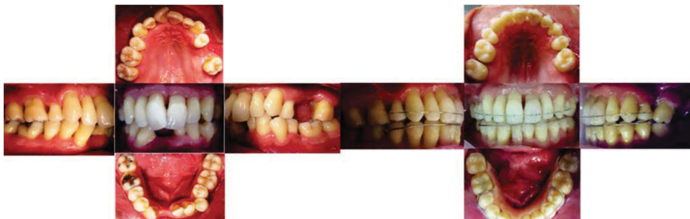
Figura 9. Comparación antes y después del tratamiento de ortodoncia. Retenedores: superior con alambre de acero 0.014 en cara vestibular e inferior placa Hawley con pónico provisional en O.D. 41.