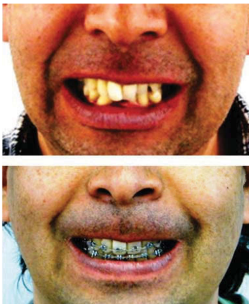
Figura 6. Sonrisa natural antes y después del movimiento de intrusión.