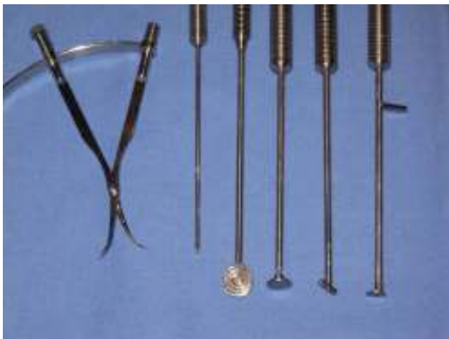
Figura 1 – Instrumental diseñado por nuestra institución para la realización del implante de condrocitos autólogos en membrana artroscópico.

describimos en este estudio se realizó la técnica por artroscopia en 53 de ellos (35,3%), mientras que en los 97 restantes (64,6%) se hizo por cirugía abierta mínimamente invasiva. En todos ellos, la membrana con las células se fijó, bien con fibrina, bien suturándola directamente al cartílago adyacente.