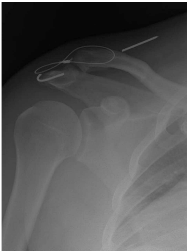
Figura 4 – Complicación tardía tras no extraer totalmente el material.

tratamiento hablan a favor de la cirugía en pacientes jóvenes con demanda laboral física importante o que practiquen deporte 23 , aunque, al no existir estudios prospectivos, aleatorizados de nivel 1 de evidencia, la decisión acerca del tratamiento de las lesiones AC tipo III de Rockwood debería hacerse de forma individualizada, teniendo en consideración factores ya comentados, como la edad, los requerimientos físicos del paciente, el nivel deportivo y el momento de la temporada, en caso de ser deportista. Si la elección fuera el tratamiento conservador, es imprescindible contar con la mayor conformidad del paciente para conseguir un resultado óptimo, lo cual no es fácil en pacientes jóvenes y activos. Si el tratamiento fuera quirúrgico, hay que tener en cuenta la gran cantidad de técnicas disponibles, que serán comentadas en siguientes artículos de este monográfico, los pros y contras de cada una de ellas y las posibles complicaciones descritas (fig. 4).