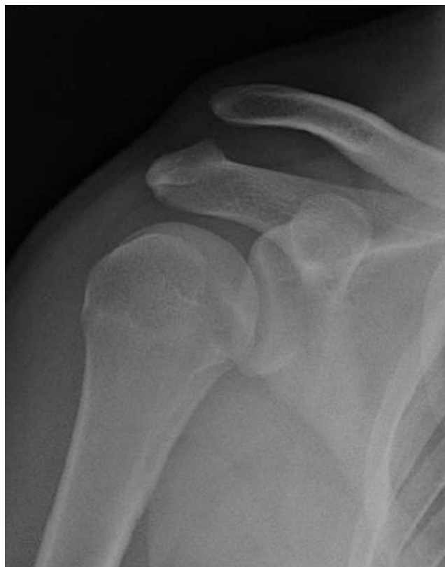
Figura 1 – Luxación acromioclavicular tipo III de Rockwood en el hombro derecho.

A pesar de ser la clasificación más extendida y ampliamente aceptada, ni las formas dinámicas de inestabilidad AC ni las inestabilidades multidireccionales quedan reflejadas,