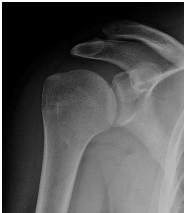
Figura 3 – Resultado final tras la extracción de material.