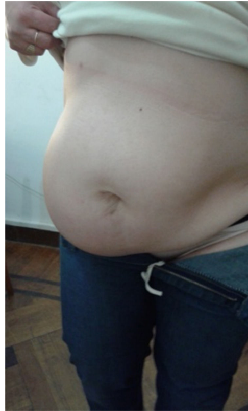
Figura 1 - Abombamiento de la fosa ilíaca derecha.

Después de la extracción de 1 500 cc de contenido quístico, quedó como remanente una pequeña formación quística