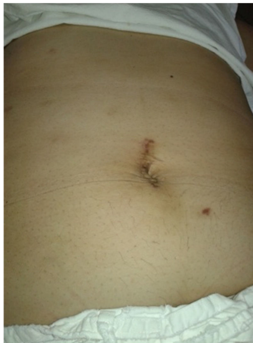
Figura 6 - Abdomen tras drenaje percutáneo.

A pesar de ser aceptada mundialmente por la comunidad médica, esta técnica originaba una hernia por trocar considerada una rareza (entre el 1-2%). Estudios más recientes refieren una prevalencia de entre el 30-40% 3 .