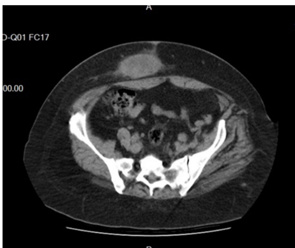
Figura 5 - Imagen en tomografía tras punción.

No obstante, nos enfrentamos con otros problemas que creíamos superados con esta técnica, como son las hernias incisionales por los orificios de puerta de entrada, cuya frecuencia varía en las distintas series publicadas.