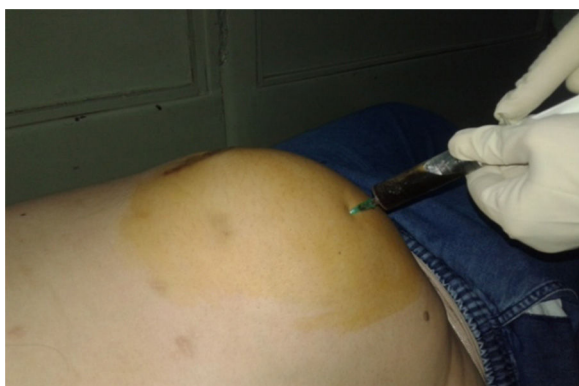
Figura 4 - Punción evacuadora.

precoces, hasta tal punto que esta es considerada como el gold standard en el tratamiento de la litiasis vesicular sintomática.