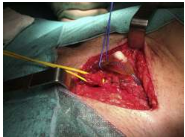
Figura 6 – Resultado final con la aponeurosis del músculo oblicuo mayor suturada.