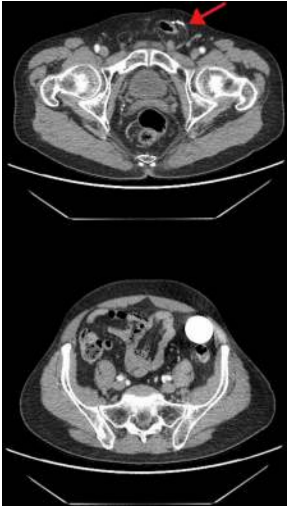
Figura 2 – Tomografía computarizada abdominal (corte axial): Arriba: se observan los dispositivos del sistema junto al saco herniario inguinal izquierdo (flecha). Abajo: Balón-reservorio en fosa ilíaca izquierda.