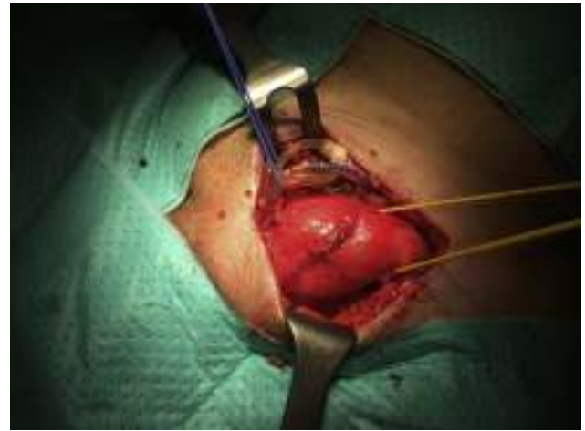
Figura 4 – Cordón espermático referenciado con hilo amarillo con hernia inguinal indirecta.