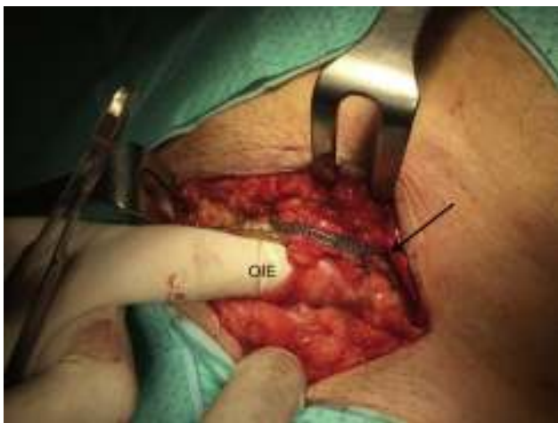
Figura 3 – Tubos de silicona del sistema entrando a través de la fascia del oblicuo mayor (flecha) por encima del orificio inguinal externo (OIE).