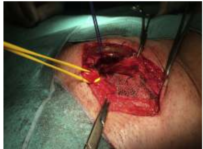
Figura 5 – Malla de polipropileno situada debajo de la aponeurosis del músculo oblicuo mayor.