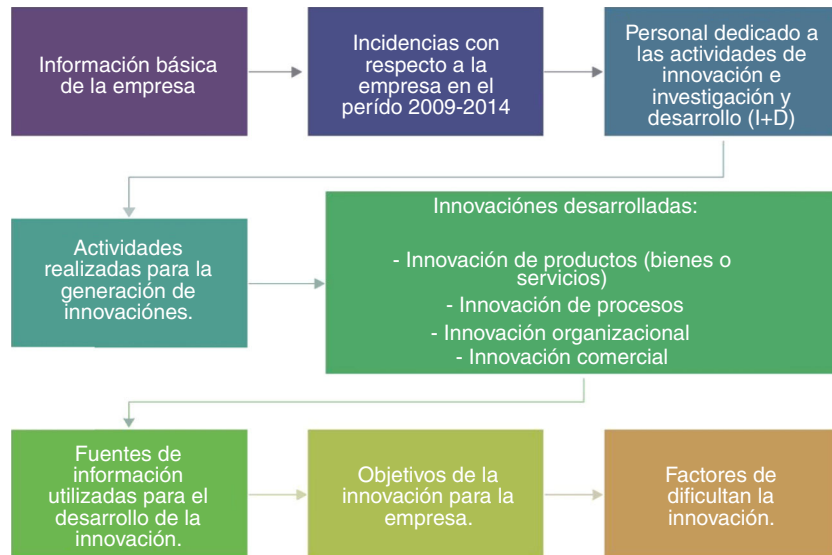
Figura 2 – Estructura de la encuesta aplicada.