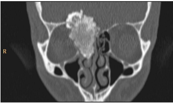
Figura 2 TC de senos paranasales, corte coronal. Masa heterogéneamente densa de 46 mm de longitud craneocaudal, invade celdas etmoidales derechas y la parte medial de la órbita adyacente.