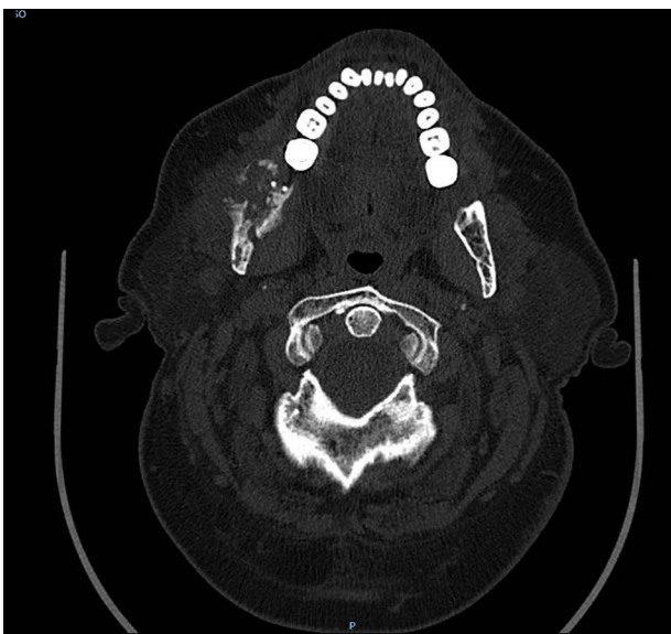
Figura 2 En la imágenes TAC se evidencia una gran destrucción ósea en 4 cuadrante mandibular. La lesión no afecta los tejidos blandos perimandibulares.