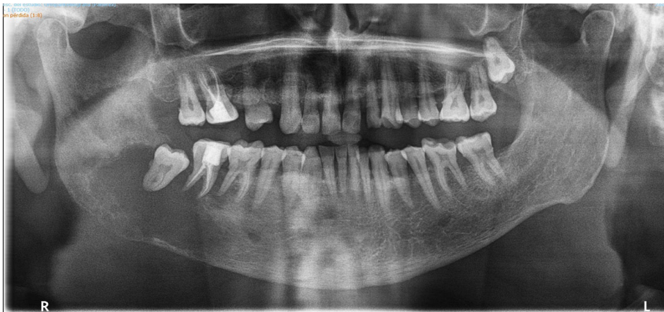
Figura 1 En la ortopantomografía se evidencia una gran lesión osteolítica en el 4 cuadrante mandíbula.