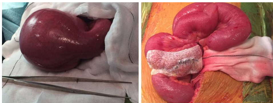
Figura 3 Pieza quirúrgica de la masa y resultado posquirúrgico.