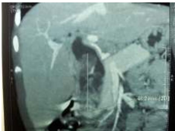
Figura 4 Reconstrucción con lesión en forma de racimo de uvas de 48,2 mm.

(23%) 4-8 . Menos frecuentemente se puede originar en los miembros superiores e inferiores (17%) o en el tronco (8%). Muchas veces se confunde con quiste de colédoco 1,9 , y a su vez es el tumor más frecuente de la vía biliar, representando el 1% de todos los rbdomiosarcomas y aproximadamente el 0,04% de todos los tumores en niños 10-12 . La apariencia radiológica es similar al quiste de colédoco cuando no existe extensión a órganos vecinos. Presenta 2 etapas cronológicas de mayor incidencia: la primera entre el primero y el séptimo año de vida, y la segunda durante la adolescencia. Su incidencia en las vías biliares extrahepáticas es muy rara 14-16 .