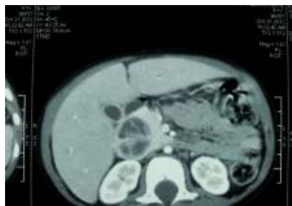
Figura 2 TAC contrastada con dilatación de la vía biliar extrahepática.