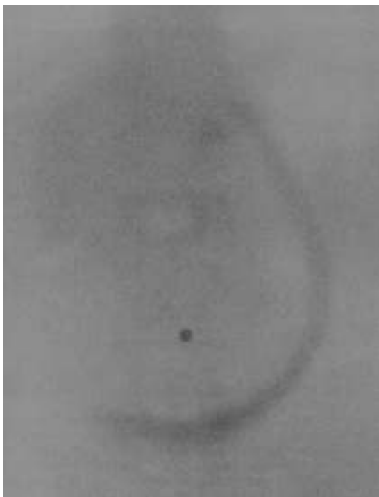
Figura 1 Imagen mostrada por Lindemann el 16 de abril de 1897 en la Asociación Médica de Hamburgo. Una sonda radiopaca define la curvatura mayor del estómago; en el ombligo una moneda sirve de punto de referencia (Verhandlungen des Aerztlichen Vereins zu Hamburg. Leipzig: Verlag von Georg Thieme; 1898. p. 28).

elevación y descenso mientras el paciente examinado respiraba fue visto muy fácilmente», afirmaba en Science Charles L. Norton (Cambridge, Massachusetts) tras unas pruebas realizadas en abril de 1896. «El bazo hipertrofiado puede ser delineado con gran claridad, siendo más bien transparente, mientras que el abdomen es normalmente bastante opaco», añadía 1 . La casi imposibilidad de estudiar el tracto gastrointestinal y los primeros intentos por solventar el problema es lo que el presente artículo aborda, no sin antes advertir de que la ordenación cronológica de las distintas técnicas ideadas y sus autores resulta difícil, debido a la inmensa actividad radiológica simultánea y semejante habida entonces en todo el mundo. Este artículo pretende quedar solo como una aproximación, y será injusto con los nombres de muchos investigadores que no aparecerán aquí.