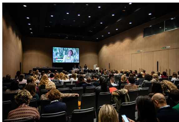
Figura 3 Mesa redonda «El paciente como centro de la atención».