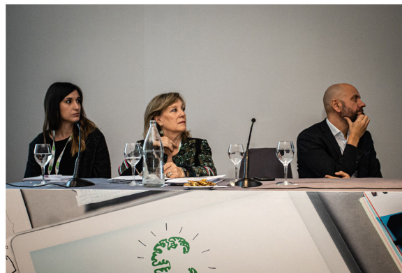
Figura 1 Mesa redonda internacional «Enfermería de práctica avanzada caminando hacia la especialidad».