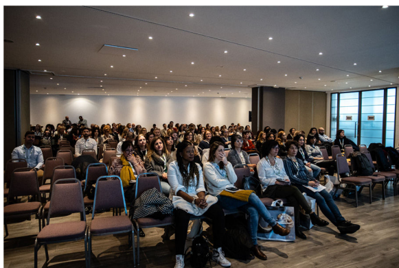
Figura 2 Vista general de la sala de comunicaciones y ponencias.