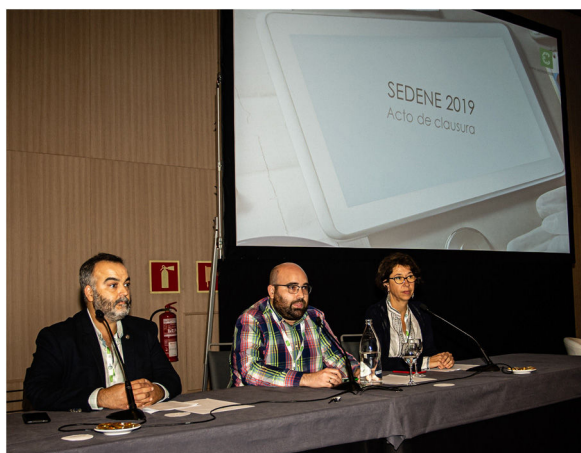
Figura 4 Acto de clausura.

zando y dejando atrás las prácticas basadas en la costumbre (fig. 4).