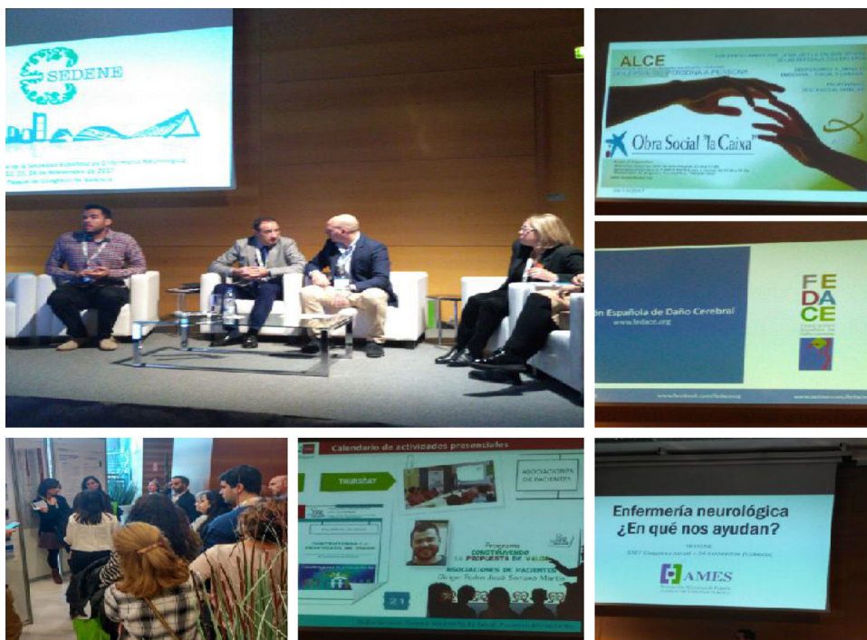
Figura 1 Comunicaciones y trabajos presentados. Mesa de debate.

joven de Neurorehabilitación (NRHSEDENE)— inició su andadura el Grupo de Epilepsia (EPISEDENE).