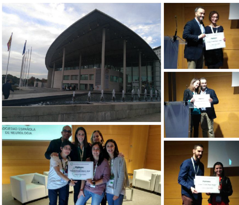
Figura 3 Entrega de premios. Sede Oficial: Palacio de Congresos de Valencia.