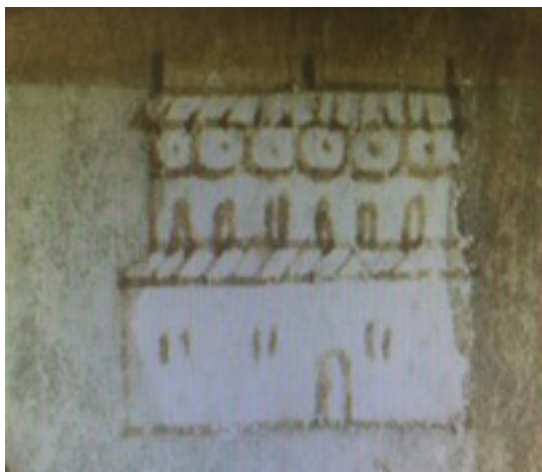
Imagen 2: Edificio que ocupó la Universidad. Detalle del mapa de Uppsala

“¿Qué edificio es ése con tantas y tan grandes ventanas arriba y abajo, que por un lado da a la plaza, y por el frente a la calle pública, en el cual entran los jóvenes ya de dos en dos, ya como si fueran acompañando a un maestro por honrarle, y llevan capas largas y bonetes cuadrados metidos hasta las orejas?”