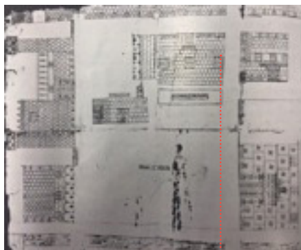
Imagen 3. Mapa de 1562

“Para el número y concurrencia de estudiantes tiene bastante amplitud el patio; y por este lado izquierdo hay espacio sobrado para cuadrar el edificio, igualando el lado derecho...”(Cervantes de Salazar, 2001: 4 y 5).