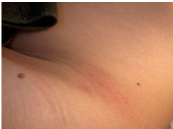
Figura 1 – Eritema en cadera.

En los últimos años se ha observado un aumento en la parasitación del ser humano por estos artrópodos, hasta ahora