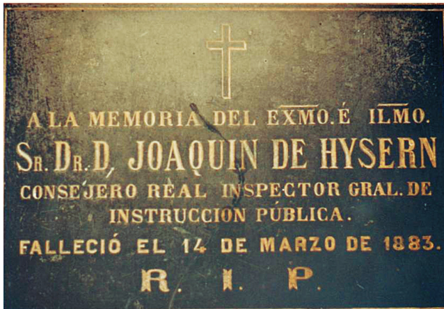
Figura 2 Lápida del Dr. Hysern en la Sacramental de San Isidro.

Que la tierra le sea leve y los homeópatas conserven su fructífero recuerdo, como nosotros tratamos de preservar su memoria entre nosotros.