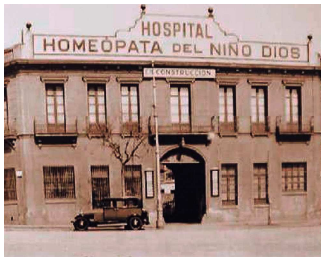
Figura 6 Hospital Homeopata del Niño Dios, Barcelona.

Ese mismo año —interesado por la medicina homeopática— fue uno de los fundadores del Instituto de Homeopatía de Barcelona, secretario de su sección científica y activo conferenciante de la entidad, además de colaborador habitual de la Revista Homeopàtica Catalana .