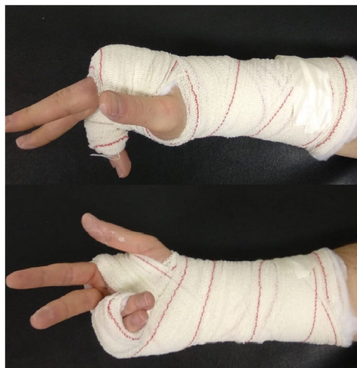
Figura 1 Inmovilización en intrínseco plus realizada para este estudio.

Varios autores han informado que se pueden lograr resultados funcionales con poca o ninguna corrección de estas fracturas en el plano sagital 6–8 . Sin embargo, la angulación marcada y la mala consolidación resultante pueden dar lugar a una protuberancia dorsal además de la pérdida de prominencia de la cabeza del metacarpiano al cerrar el puño 9 . Hay autores que afirman que el acortamiento y angulación del metacarpiano mayor de 30° también puede generar dificultades secundarias a la alteración de la mecánica de la mano en pacientes que son trabajadores manuales que requieren realizar actividades de agarre forzado 10,11 . Tradicionalmente, el tratamiento de esta fractura consiste en una reducción cerrada e inmovilización con férula externa