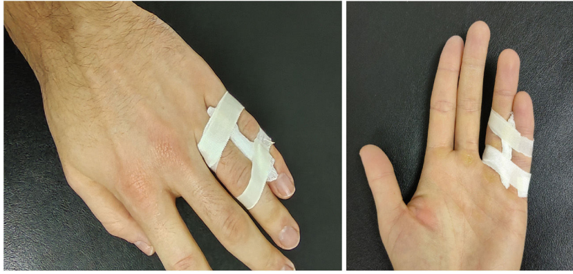
Figura 2 Inmovilización con sindactilia realizada para este estudio.

tipo de inmovilización), recomendándose usar la mano con normalidad 4 .