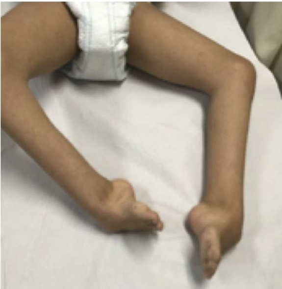
Figura 1 Paciente de 13 años con síndrome Cornelia de Lange y pies zambos bilaterales.