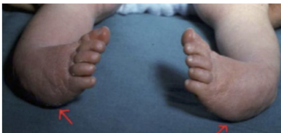
Figura 4 Pie zambo sindrómico bilateral, en el que se aprecia otro de los signos de la clasificación de Pirani: borde lateral curvado.