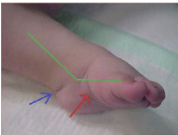
Figura 3 Pie zambo en el que se pueden observar tres de los signos de la clasificación de Pirani: pliegue medial (flecha roja), pliegue posterior (flecha azul) y componente equino (línea verde).