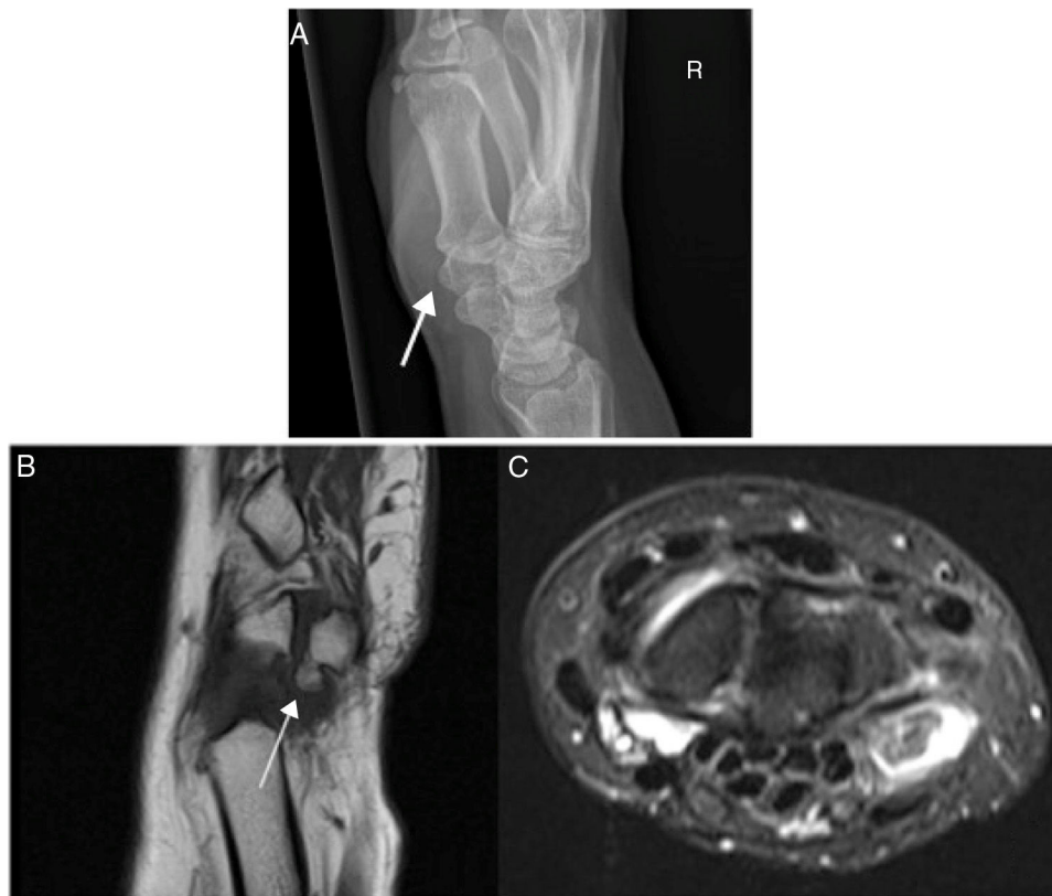
Figura 1 A) Radiografía Simple. Imagen en exofítica con continuidad con la cortical del hueso adyacente con una base ancha a nivel del pisiforme. B-C) Resonancia magnética del carpo. Osteocondroma solitario pediculado en el pisiforme siendo lesión exofítica con continuidad córticomedular en polo proximal de 5x5 mm rodeada de líquido sinovial con estructuras tendinosas y ligamentosas correctas.

localizados en el húmero proximal, fémur distal o tibia, siendo el carpo una localización extremadamente rara 1 . Hasta la fecha, existen casos descritos en el escafoides 2,3 , hueso grande 4,5 , semilunar 6 , trapecio 7 y trapezoide 8 . Presentamos un caso de un osteocondroma solitario en el hueso pisiforme asociado a una artrosis piso-piramidal.