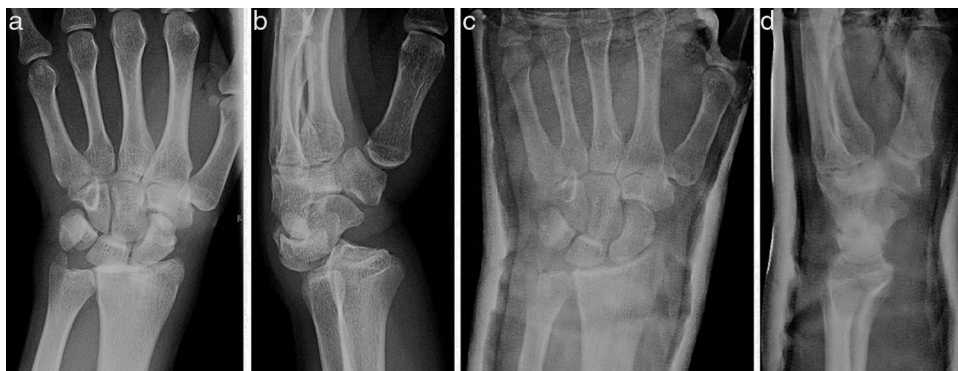
Figura 1 Radiografía simple AP y lateral a la llegada a urgencias (a y b), y tras la reducción (c y d).