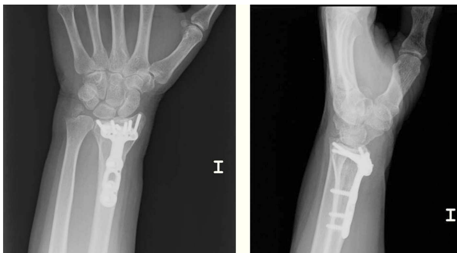
Figura 2 Proyecciones radiográficas con moldes correctores. Se puede valorar la protrusión leve de los tornillos a nivel intraarticular y a nivel dorsal.

manifiesta del tornillo. Se especula que esta situación podría provocar deterioro articular a largo plazo.