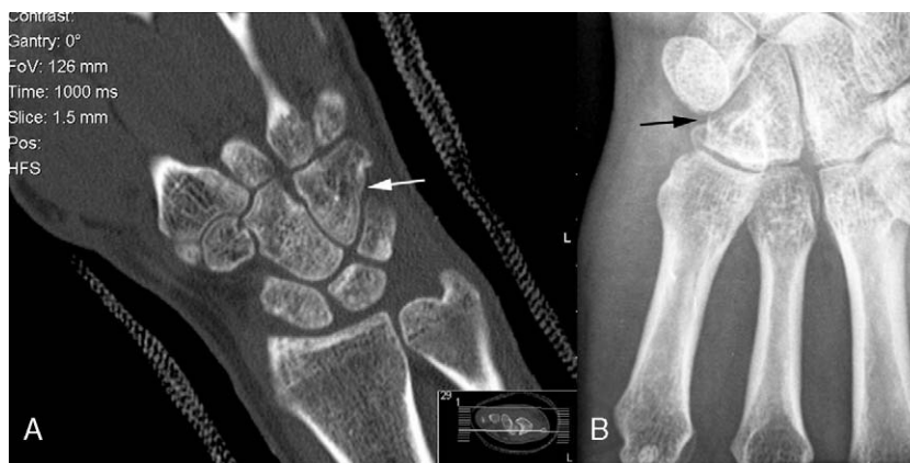
Figura 2 A) TC control a la octava semanas. B) Control Rx a las 16 semanas.

Dado el pequeño tamaño y el poco desplazamiento del fragmento óseo principal, se decidió iniciar tratamiento conservador con una férula dorsal de yeso durante una semana para control del edema.