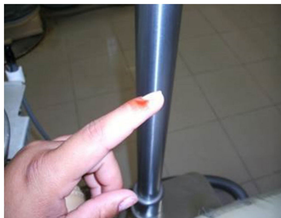
Figura 1 – Sangría en punto de acupuntura IG 1.

De los 43 pacientes diagnosticados de pulpitis, 37 fueron atendidos con acupuntura y manifestaron EVA inicial de grado