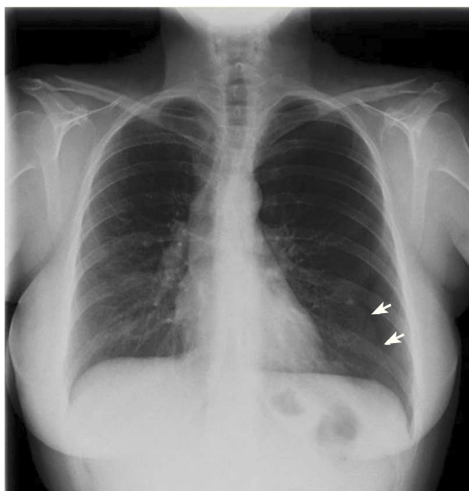
Figura 1 – Caso 1. Radiografía de tórax con neumotórax izquierdo.

Niño de 4 años, de nacionalidad china. Sus padres refieren que tras una sesión de acupuntura se queja de dolor en región lumbar. A la exploración, en la región lumbar se observan algunos signos de punción, con leve eritema perilesional, discreto aumento de la temperatura local, sin fluctuación ni hematomas. Se realiza radiografía donde se evidencia un cuerpo extraño subcutáneo, un fragmento de aguja, a nivel de la punción (fig. 2). El paciente fue derivado al hospital, donde se extrajo el fragmento de aguja sin complicaciones posteriores.