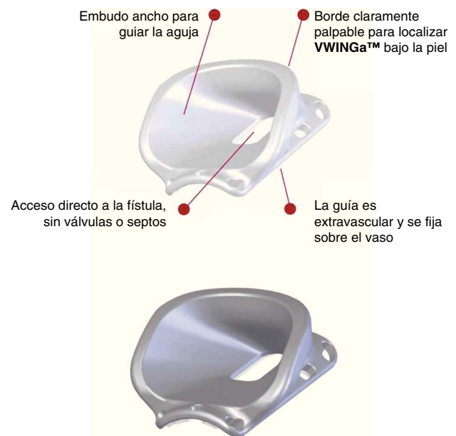
Figura 1 Orificios de sutura y localización del embudo de la guía VWNG.

vaso mientras se colocan las suturas ya que puede reducir la incidencia de suturar la pared posterior o una válvula.