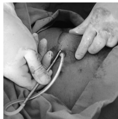
Figura 2. Realización del túnel del catéter con tunelizador.