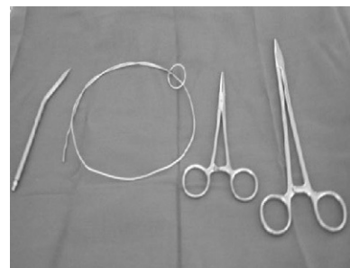
Figura 1. Instrumental empleado en la colocación percutánea: tunelizador, guía de alambre, pinza de Kelly recta y porta agujas.

3. Realización del túnel: selección del sitio de salida en un ángulo de 90° de inclinación partiendo de la línea media del paciente. El extremo distal del catéter será insertado al tunelizador, este permitirá realizar el túnel y orificio de salida al mismo calibre del catéter. Se introducirá en el espesor del tejido adiposo o inmediatamente debajo de este, cuidando de no estirar, rotar o