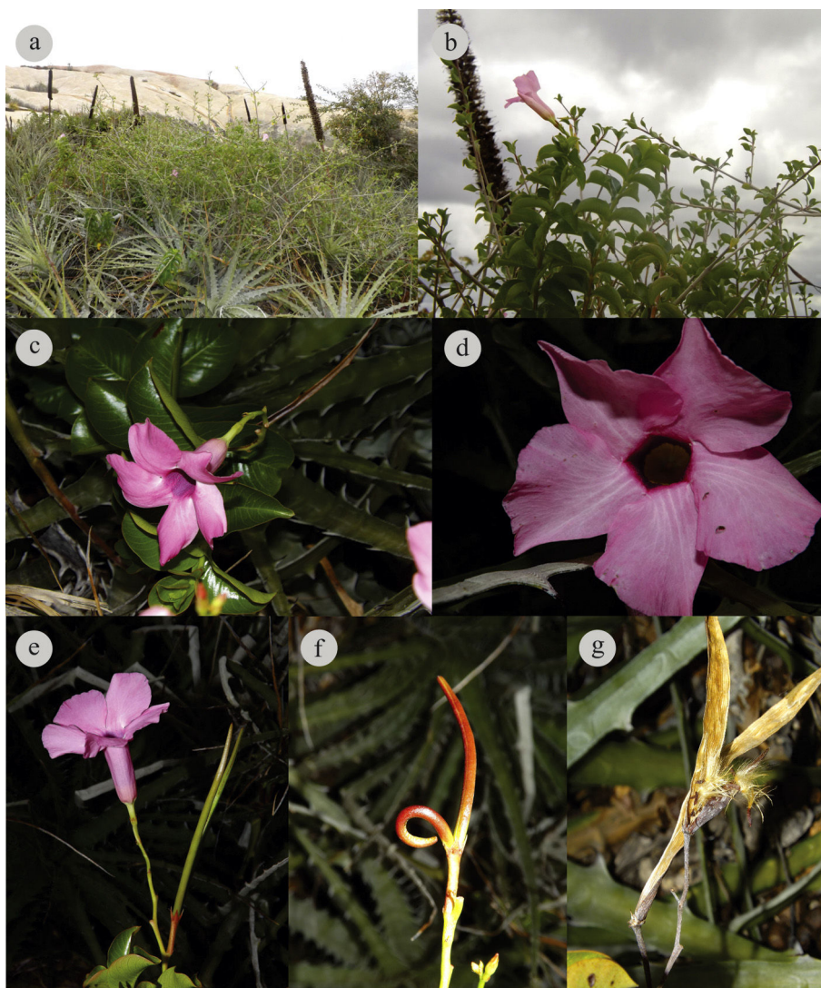
Figura 2. a) Aspecto general de una de las «islas» de vegetación en la que la especie fue recolectada; b-g) Mandevilla dardanoi : b) hábito; c-d) detalle de la flor; e) flores y frutos; f) frutos maduros; g) semillas.

M. dardanoi M. F. Sales, Kinoshita-Gouvêa y A. Simões, Novon 16(1): 113–115. 2006. Tipo: Brasil. Pernambuco: Brejo da Madre de Deus, Prop. Bituri, 5 feb. 1965 (fl, fr), D. Andrade-Lima 4290 (holotipo, IPA 13652) (fig. 2a-g).