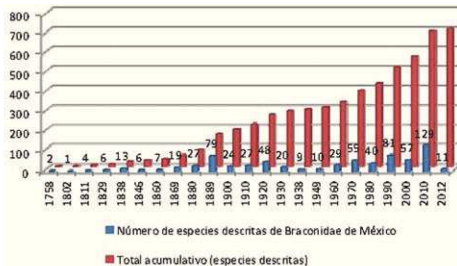
Figura 2. Curva acumulativa de especies descritas de Braconidae registradas para el territorio mexicano (desde 1758 hasta agosto del 2012).